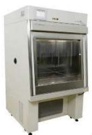
ドアのない温湿度試験槽 NO DOOR α