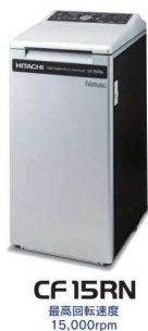
CF15RN 最高回転速度 15,000rpm