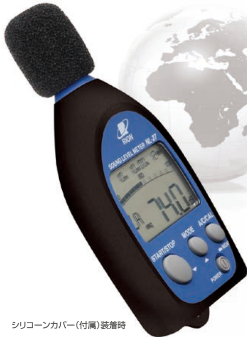
シリコンカバー(付属)装着時