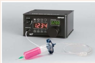
SDP420 とシリンジ接続例

SDP420は、接着剤、潤滑剤、その他の各種液剤を高精度にディスペンス可能な高性能精密ディスペンサーです。バキューム制御・便利なティーチ機能が標準装備され、安定した定量塗布作業が簡単に行えます。生産性の向上、生産効率の改善、製造コストの低減を実現します。